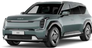
Iceberg Green (IEG) Metalliväri