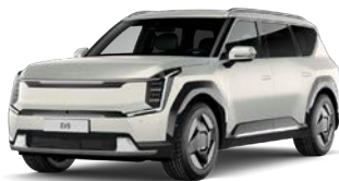
Ivory Silver (vain EV9) (ISM) Mattaväri***