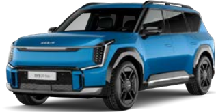
Ocean Blue (vain GT-Line) (OBG) Metalliväri