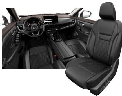
Tekna Musta - premiumnahkapenkit tikkauksilla