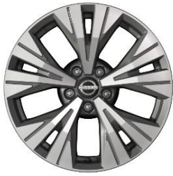
Acenta & N-Connecta 18" kevytmetallivanteet