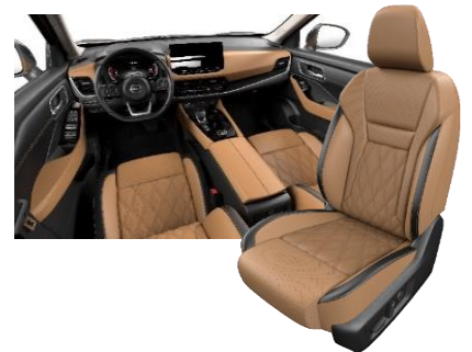
Lisävaruste Tekna(e-POWER- ja e-4ORCE-mallit) Ruskea - premiumnahkapenkit tikkauksilla