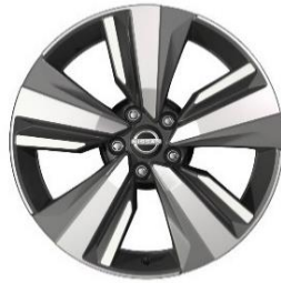
Tekna/lisävaruste N-Connecta 19" timanttileikatut kevytmetallivanteet