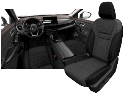
Acenta & N-Connecta Musta - tekstiili