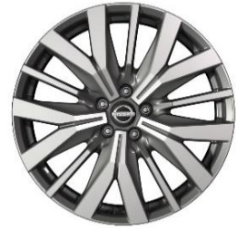
Lisävaruste Tekna 20" timanttileikatut kevytmetallivanteet