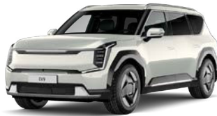
Ivory Silver (vain EV9) (ISG) Metalliväri