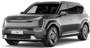
Pebble Gray (DFG) Perusväri