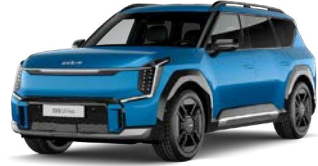
Ocean Blue (vain GT-Line) (OBG) Metalliväri