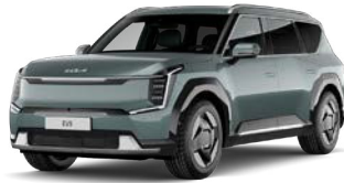
Iceberg Green (IEG) Metalliväri