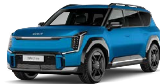
Ocean Blue (vain GT-Line) (OBM) Mattaväri***