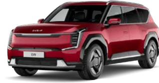
Flare Red (C7R) Metalliväri