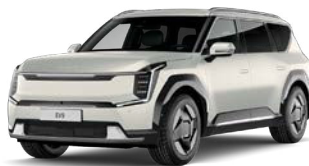
Ivory Silver (vain EV9) (ISM) Mattaväri***