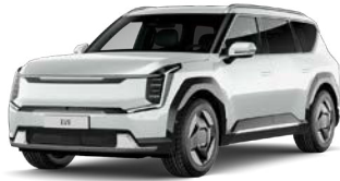
Snow White Pearl (SWP) Helmiäisväri