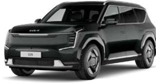
Aurora Black Pearl (ABP) Metalliväri