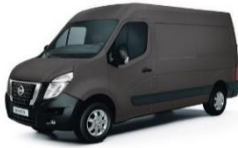
Urban Grey (GRU)