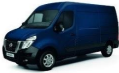
Volga Blue (VBL)