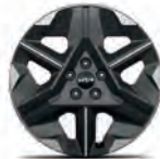
EV6 & GT-Line 19" kevytmetallivanne Renkaat: Nexen tai Kumho 235/55 R19