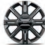
GT-Line 20" kevytmetallivanne Renkaat: Continental 255/45 R20