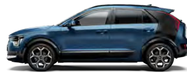
M4B + ABP