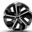
HEV ja PHEV 16"