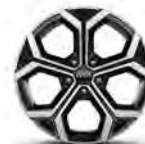
HEV ja PHEV 18"