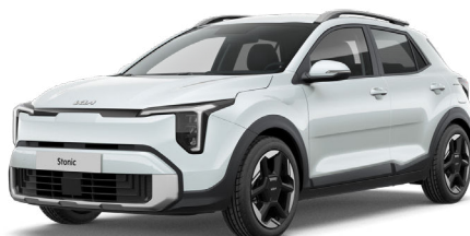
Snow White Pearl Helmiäisväri