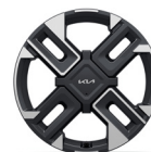
17" GT-Line kevytmetallivanteet GT-Line 205/55R17