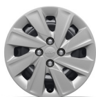
15" teräsvanteet LX-varustetaso 185/65R15