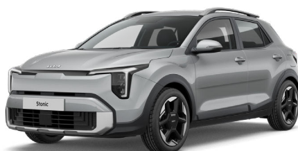
Sparkling Silver Metalliväri