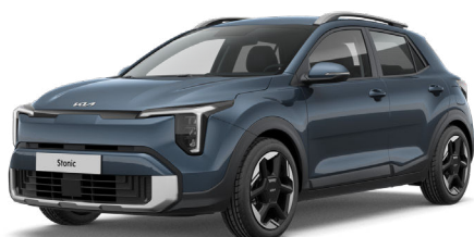
Smoke Blue Metalliväri