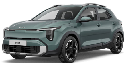
Adventurous Green Perusväri