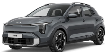
Astro Grey Metalliväri