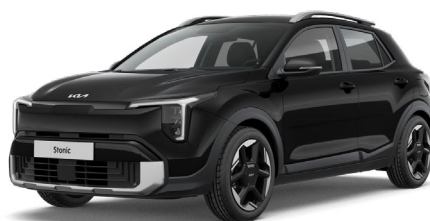
Aurora Black Metalliväri