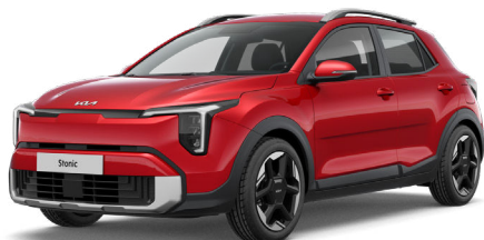
Signal Red Metalliväri