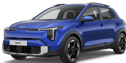
Yacht Blue Metalliväri