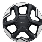
17" kevytmetallivanteet TX 205/55R17