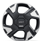
16" kevytmetallivanteet EX Rengaskoko: 195/55R16