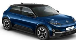
YWW Noble Marine / Musta katto