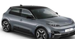
YUY Elegant Silver / Musta katto