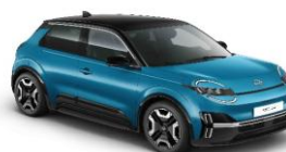
YZF Authentic Blue / Musta katto