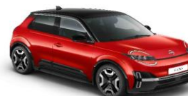
YZA Rebel Red / Musta katto