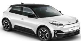
XUF Pure white / Musta katto